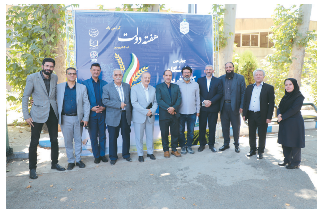
عکس دسته‌جمعی هیأت رئیسه انجمن روابط عمومی ایران با تعدادی از غرفه‌داران.