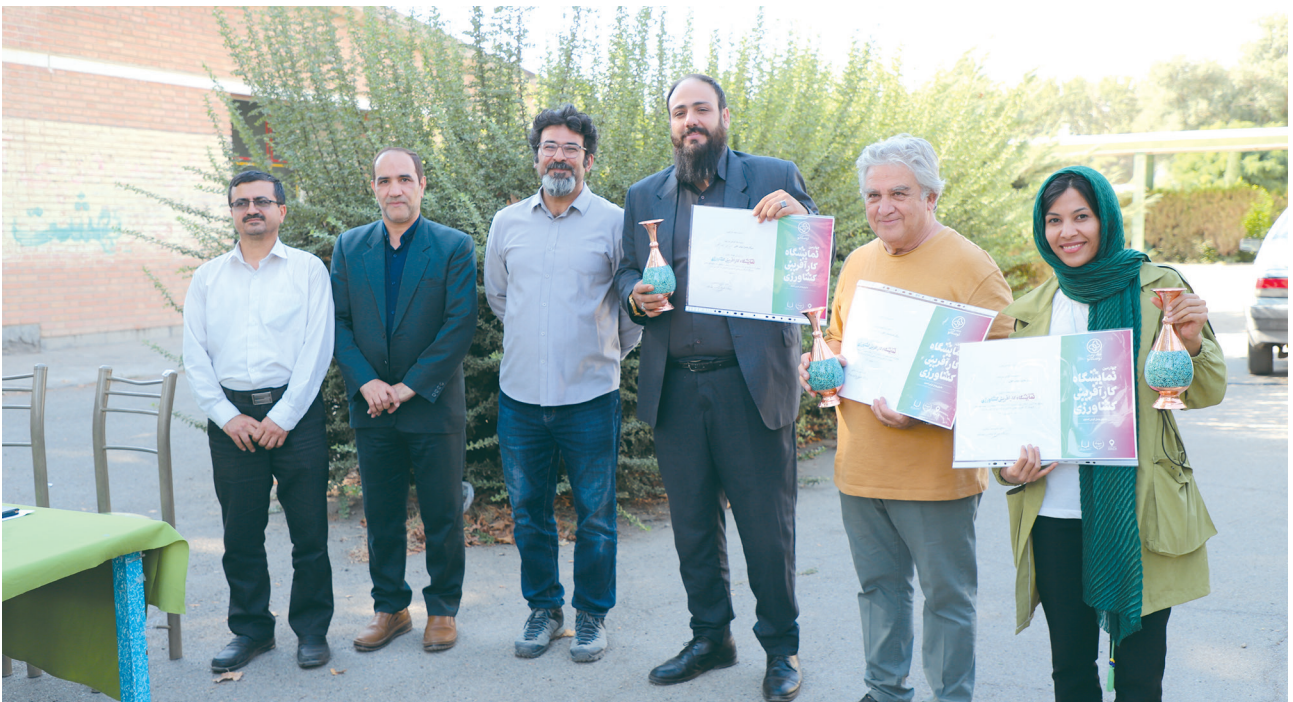
تیم‌های برتر به همراه مسئولان برگزارکننده نمایشگاه